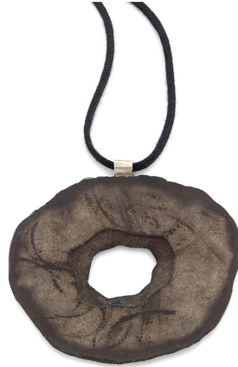
Pendentif 3, Ciment et maillechort, Pièce unique, 2000.

« Je suis ciment » disait Claude de Soria. Comme si le matériau, devenu central et indispensable à sa création, lui collait à la peau.