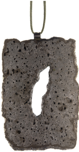
Pendentif 1, Ciment et maillechort, Pièce unique, 2000.