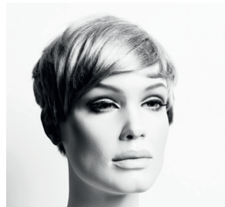
© Valérie Belin. Courtesy galerie Nathalie Obadia, Paris/Brussels

Valérie Belin – Sans titre (série Mannequins), 2003, épreuve gélatino-argentique, 100 x 80 cm