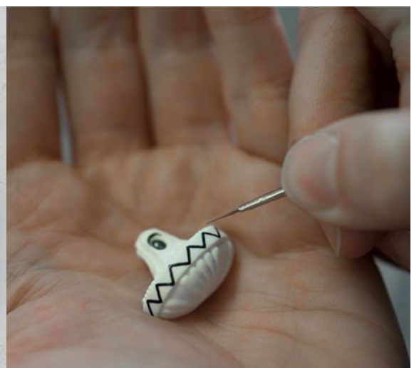
Moule du Space Defender , porcelaine émaillée verte et noire, Manufacture de Sèvres, © Yann Delacour