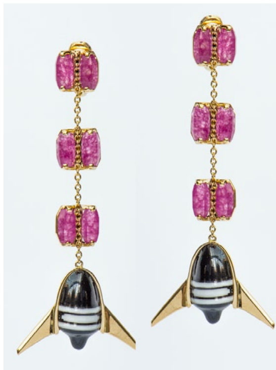
Boucles d'oreilles, deux versions : porcelaine émaillée verte et onyx verts, ou porcelaine de Sèvres émaillée noire et blanche et quartzites roses, or jaune 18k, édition de 15 exemplaires + 2EA - © Yann Delacour