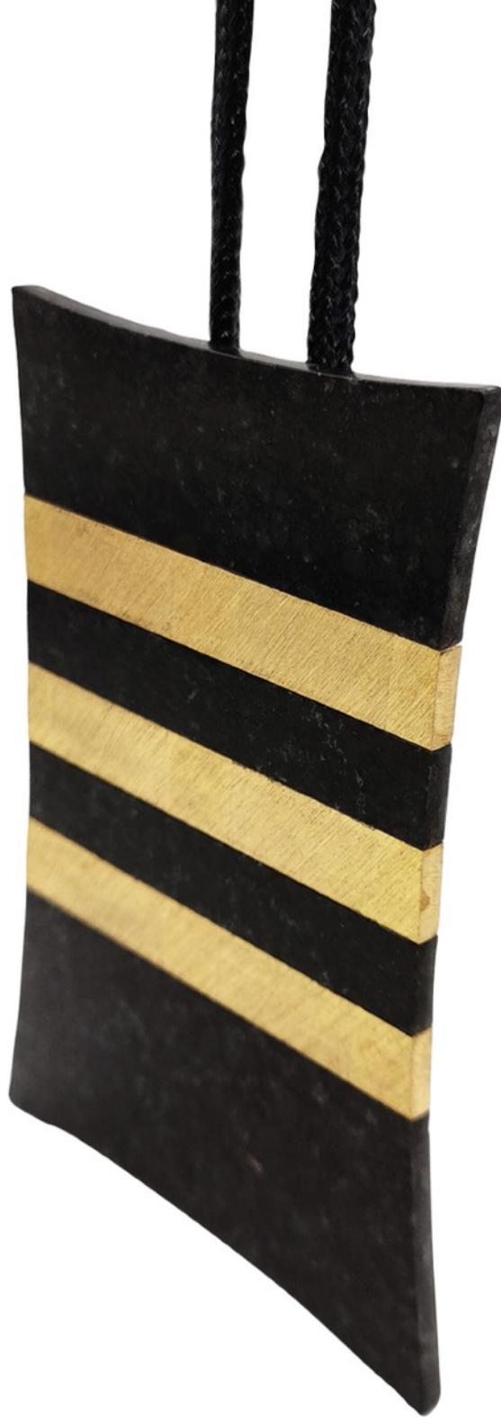
Enrique Asensi Pendentif en laiton brossé et diabase édition de 8 exemplaires pour MiniMasterpiece, 2021