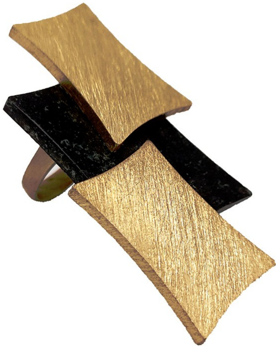
Enrique Asensi Bague en laiton brossé et diabase édition de 8 exemplaires pour MiniMasterpiece, 2021