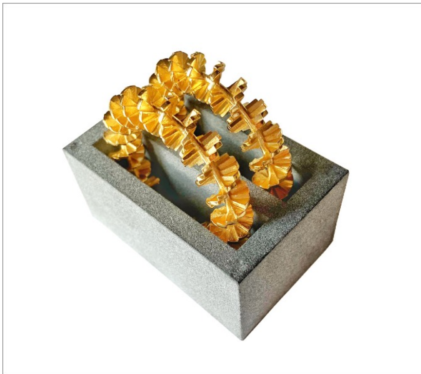
Gérard et Lucien Grandval Boucles d'oreilles « Colimaçon » dans son écrin béton Vermeil or jaune 18k 2020, édition de 15 exemplaires édition MiniMasterpiece © Lucien Grandval