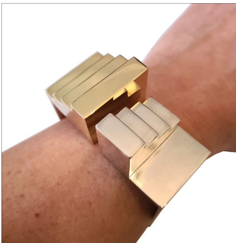
Gérard et Lucien Grandval Bracelet « Double » Argent 925 brossé et laiton doré 2020, édition de 10 exemplaires édition MiniMasterpiece © MiniMasterpiece