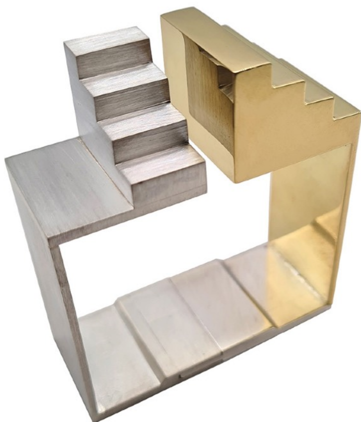
Gérard et Lucien Grandval Bracelet « Croisé » Argent 925 brossé et laiton doré 2020, édition de 10 exemplaires édition MiniMasterpiece © MiniMasterpiece