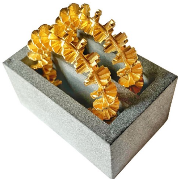
Gérard et Lucien Grandval Boucles d'oreilles « Colimaçon » dans son écrin béton Vermeil or jaune 18k 2020, édition de 15 exemplaires édition MiniMasterpiece © Lucien Grandval