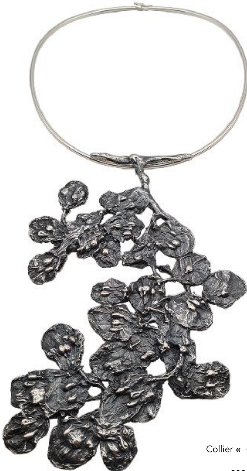
Collier « Corinthe, grains de folie »